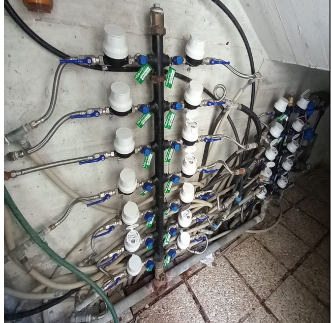
FOTO CONTATORE ANTE La foto deve inquadrare chiaramente il quadrante e i campi lettera/matricola

Situazione post- CONTATORE con installato modulo radio La foto deve inquadrare chiaramente il quadrante e i campi lettera/matricola