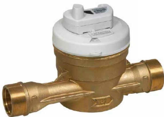
Esempio di montaggio di conta-impulsi su contatore grandi utenze marca Maddalena