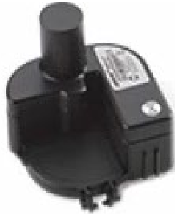
Modulo di trasmissione tipo